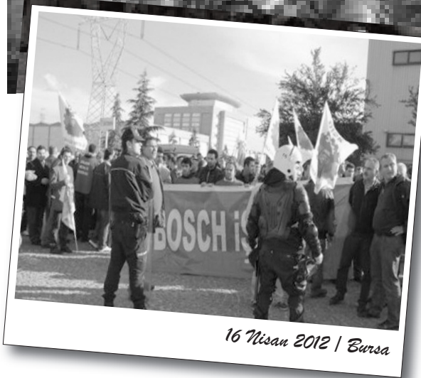
16 Nisan 2012 | Bursa