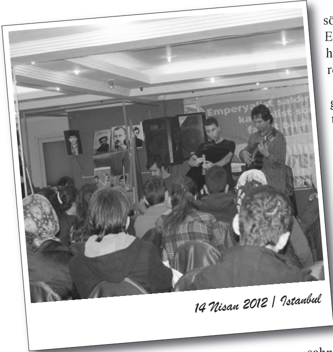
14 Nisan 2012 | İstanbul

GOP BDSP'nin 1 Mayıs hazırlıkları kapsamında düzenlediği “İşçilerin birliği, halkların kardeşliği” gecesi 14 Nisan günü gerçekleşti.