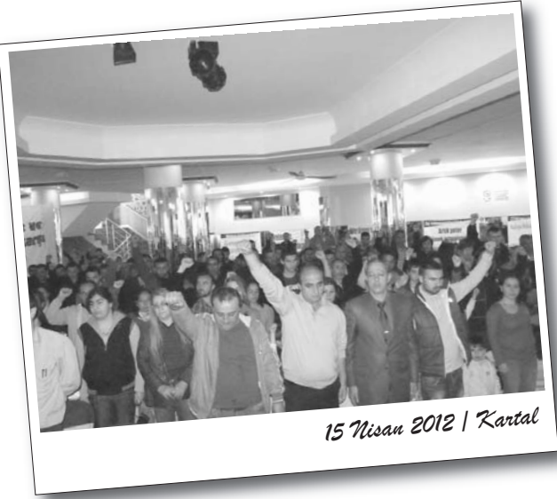
15 Nisan 2012 | Kartal

Taşeron İşçileri Kurultayı 15 Nisan günü Kartal M. Boy Düğün Salonu'nda gerçekleştirildi. Taşeron köleliğine karşı mücadeleyi büyütme iradesinin öne çıktığı kurultayda, 'Taşeron İşçileri' pankartı arkasında 1 Mayıs'ta Taksim'de olma çağrısı yapıldı.