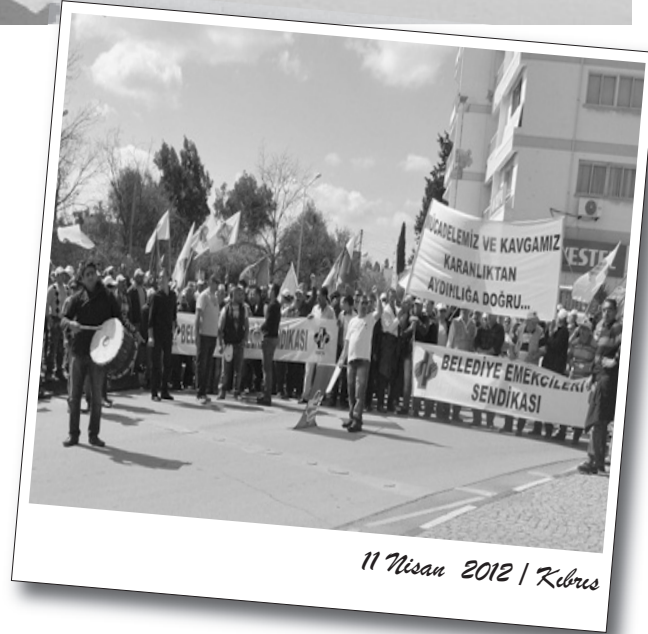
11 Nisan 2012 | Kıbrıs

Gözaltına alınanlar serbest bırakılana kadar emniyet müdürlüğü önünden ayrılmayacaklarını açıklayan BES üyeleri, gözaltındakilerin ifadeleri alındıktan sonra serbest bırakılacağını açıklanmasının ardından dağıldı. Gözaltına alınan emekçiler 17 Nisan sabahı serbest bırakıldı.