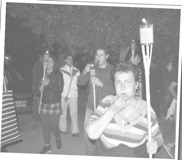
16 Nisan 2012 | Kıbrıs

Lefkoşa Belediyesi emekçileri, maaşlarının halen ödenmediği gerekçesiyle sokağa döküldü. Belediye Emekçileri Sendikası (BES) ikinci kez süresiz greve gitti. Önceki grevde anlaşma sağlanması nedeniyle grev durdurulmuştu. Ancak patronla imzalanan protokolün gerekleri yerine getirilmediği için 11 Nisan günü itibarıyla ikinci kez süresiz grev başlatıldı. BES üyeleri 12 Nisan günü de, Lefkoşa Belediyesi önünden Cumhuriyet Meclis'i önüne yürüyüş gerçekleştirdi.